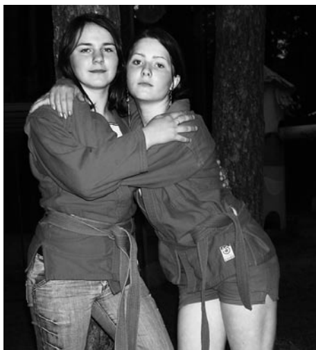
Сила и красота