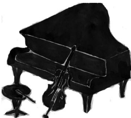
Риснок Полины Евсеевой, 15 лет