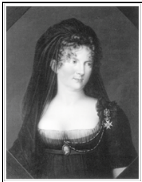
Г. Кюгельген Портрет Марии Фёдоровны