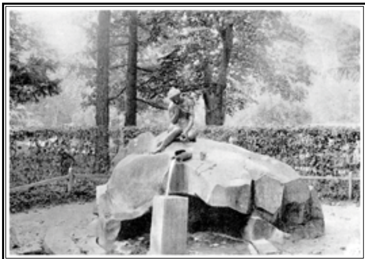
Царское Село. «Разбитый кувшин»