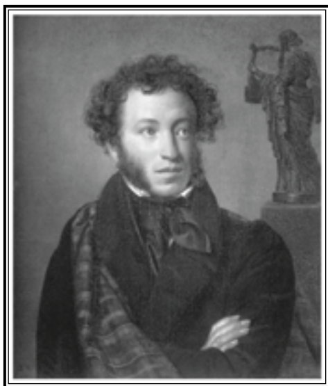
О. Кипренский Портрет поэта А.С. Пушкина