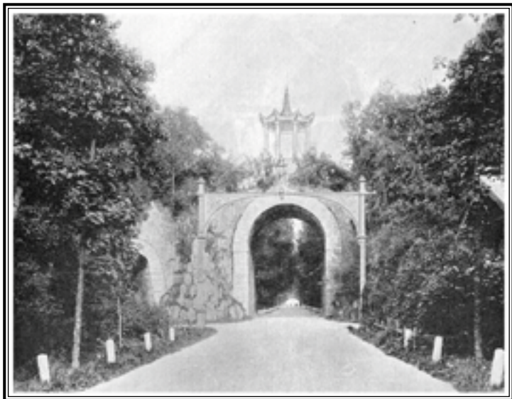
Царское Село. Подкапризная дорога