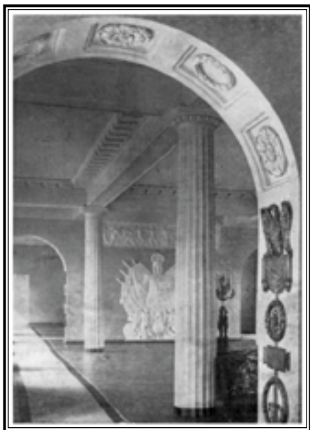
Лицей. Актный зал