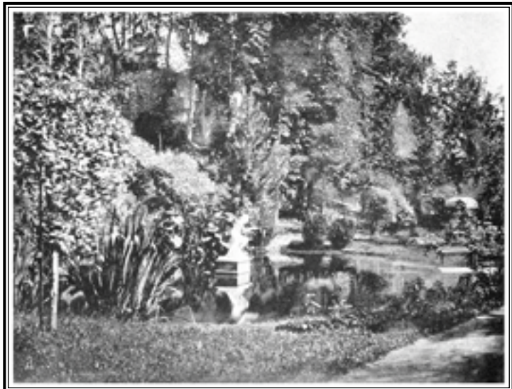
Царское Село. «Рыболов» Ставассера