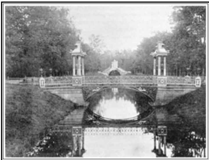
Царское Село. Китайский мост