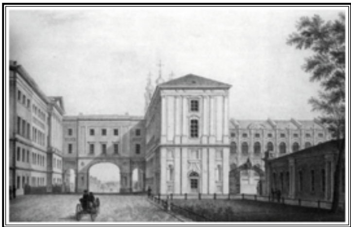
А. Тон. Вид лицея из Екатерининского дворца